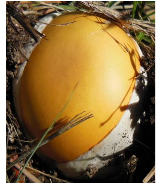
Amanite des Césars